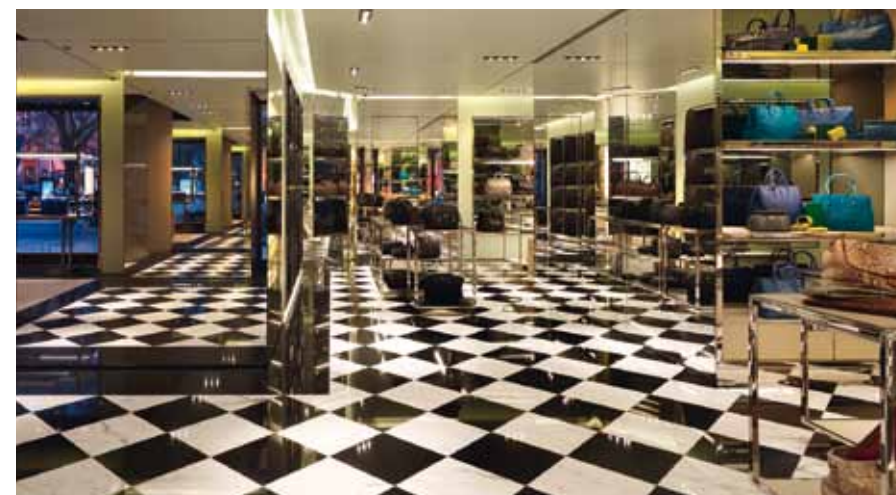
► PRADA KURFÜRSTENDAMM 186 CHARLOTTENBURG T 030 88710840