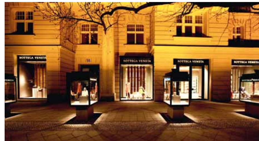
► BOTTEGA VENETA KURFÜRSTENDAMM 59-60 CHARLOTTENBURG T 030 70550770